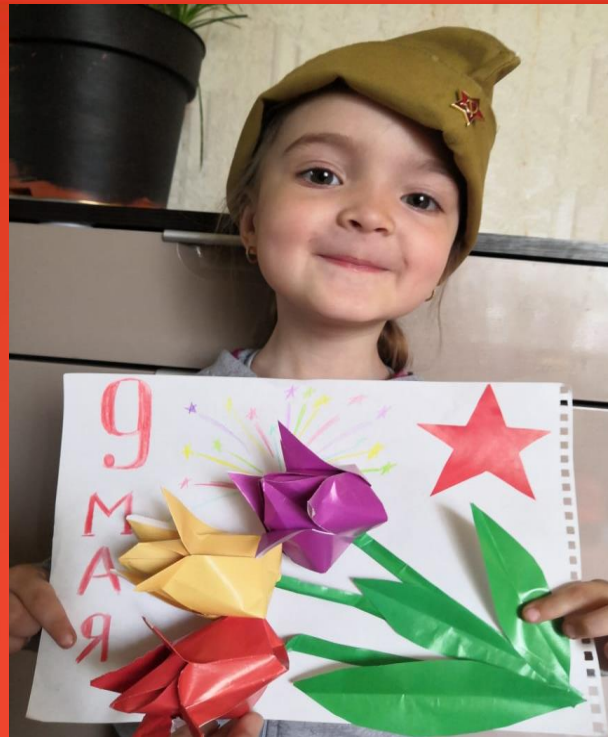
Младше-средняя группа Детского сада 95 Выставка детских работ "Дети наши цветы"